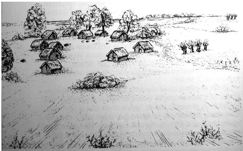
Raně slovanská vesnice podle L. Galušky

V průběhu 6.-7. století se tak Slovanům podařilo obsadit nebyvalé prostory sahající od Peloponésu až k Ladožskému jezeru a od Labe až k Volze. Na tomto rozlehlém území začalo vznikat mnoho kmenových knížectví a kmenových svazů, které se později začaly stávat, někdy i s přispěním dalších etnických elementů, základem nových státních útvarů - velkomoravské říše, českého knížectví, polského státu, kyjevské Rusi, útvarů Charvátu a Srbů, bulharské říše a mnoha dalších. Tyto státní útvary pak začaly v průběhu 9.-10. st. adaptovat evropské modely státní správy a tím i křesťanství, jen slovanské kmeny sídlící v povodí Labe a při Baltském moři se pohanství držely až do 12. století, než byly německým sousedem podmaněny a v průběhu několika staletí zcela germanizovány.