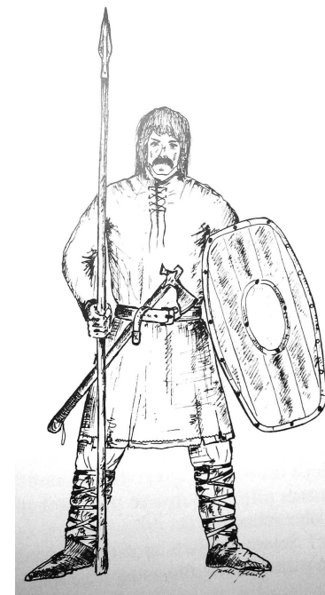
Slovanský bojovník podle L. Galušky

Zničení gótské říše Huny na poč. 4. stol. vyvolalo rozsáhlé migrační procesy známé jako tzv. stěhování národů . Většina Gótů se ze slovanského sídelního prostoru stáhla na západ a po zániku hunské říše smrtí Attily (453) zůstaly slovanské kmeny svobodné, díky čemuž začaly značně mohutnět a získávat na vojenské síle. V první pol. 6. století tak začíná období slovanské expanze . Tato expanze nebyla náhodnými pochody malých skupinek mírumilovných zemědělců, jak si jí v minulosti snažili vylíčovat romantičtí dějepisci, ale byly to promyšlené a dobře organizované vojenské invaze, při kterých si Slované počínali stejně kruté a nemilosrdné, jako jiné barbarské národy té doby. Můžeme říci, že se Slované dobře orientovali i v tehdejší mezinárodní situaci, neboť pro napadení protivníka často záměrně využívali situace, kdy byl oslaben boji s jinými nepřáteli. Tak např. slovanská expanze na Balkán by nebyla možná, kdyby největší síly byzantského vojska nebyly až do pol. 7. st. vázány vyčerpávajícími válkami s Peršany. Slovanské výboje byly navíc usnadněny spoluprací s Avary (ať už dobrovolnou či nedobrovolnou), kteří se v druhé pol. 6. st. usídlili v Panonii. I české země Slované obsadili po té, co Langobardi, kteří